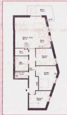
Grundriss Wohnung 3 im 1. OG; 4-Zimmer auf 120,6 m 2

Weitere Informationen finden Sie auch unter www.volksdorferdamm31.de